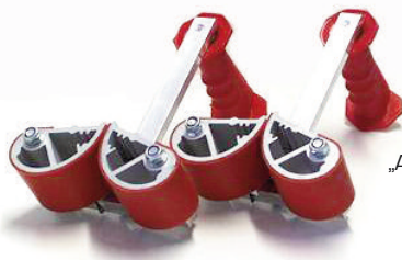
„Anti-Slip“ Handgriffe zum sicheren Heben und Tragen von Blechen