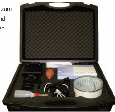
HOLMA® Sichtgerät zum Prüfen von Laserlinsen auf Verschmutzung und Defekte.