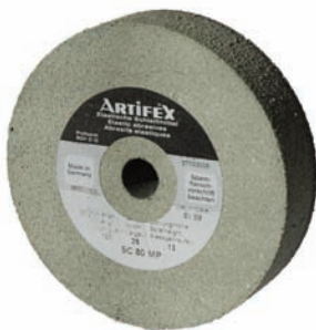
Gummierte Schleifscheibe zum Säubern der Stempel von Materialaufbau