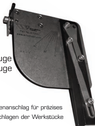
Seitenanschlag für präzises Anschlagen der Werkstücke